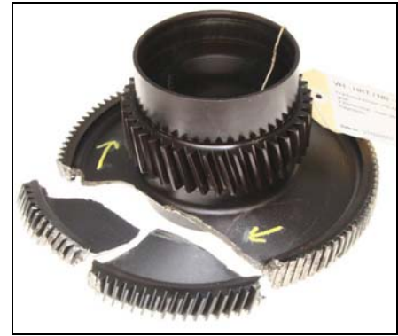
Photo 2. Roue dentée brisée de l'accident en Australie

Le 2 février 2007, un hélicoptère sanitaire, modèle 407, de Bell Helicopter Company a quitté Tamworth, en Nouvelle-Galles du Sud (Australie) à destination du lieu d'un accident de voiture. Le pilote a signalé que le voyant d'indication du détecteur de particules du moteur s'était allumé sur le tableau principal des voyants d'avertissement. Environ cinq secondes plus tard, il a entendu une vibration en fréquence, suivie d'une panne complète de moteur. Un examen préliminaire a montré que la roue dentée du couplemètre s'était brisée du fait d'une crique de fatigue émanant de l'implanture d'une dent de roue dentée périphérique (voir Photo 2). Un contrôle magnétoscopique a révélé des signes de criquage à l'implanture de plusieurs autres dents de roue dentée près de l'endroit de la rupture. Un écaillage localisé des dents et des marques de contact inégales en surface ont également été relevées.