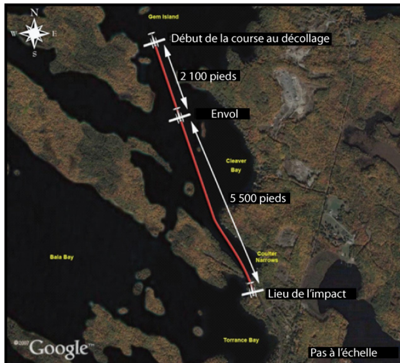
Figure 1. Trajectoire de vol estimée

L'avion a été photographié alors qu'il était quasiment en palier à environ 40 pieds au-dessus de la surface du lac. C'est la dernière fois que l'avion a été observé avant que se produise l'impact avec les arbres qui sont situés sur la rive sud de Coulter Narrows. L'avion se trouvait alors à une distance approximative de 5 500 pieds par rapport au point d'envol et à une hauteur estimée de 90 pieds au-dessus de la surface du lac (voir la figure 1).