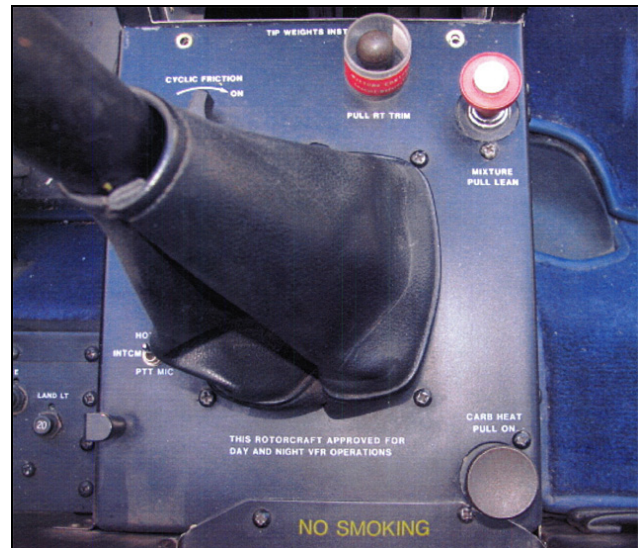
Photo 1. La console centrale montrant la commande de richesse dans le coin supérieur droit et la commande de réchauffage carburateur dans le coin inférieur droit

Les commandes de richesse carburant et de réchauffage carburateur se situent sur la console centrale à proximité l'un de l'autre. Pour bien les distinguer, les commandes n'ont pas la même forme. De plus, la commande de richesse carburant est rouge alors que celle du réchauffage carburateur est noire (voir la photo 1). Pour éviter que la commande de richesse ne soit activée par inadvertance en plein vol, la liste de vérifications du fabricant indique au pilote qu'il doit mettre un protecteur en plastique cylindrique amovible autour de la commande avant de démarrer le moteur (voir la photo 2). Ce protecteur ne doit pas être enlevé avant l'arrêt du moteur, lorsque la commande de richesse est réglée en position « étouffoir » (voir la photo 3). Ce protecteur de plastique n'est pas fixé de manière permanente au panneau de commande. Bien que le protecteur de plastique ait été retrouvé sur le lieu de l'écrasement, on n'a pas pu déterminer s'il était utilisé au moment de l'événement.