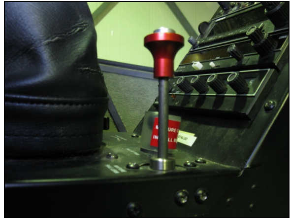
Photo 3. La commande de richesse en position « étouffoir », le protecteur enlevé

Le moteur et les commandes carburant ont été trouvés dans les conditions suivantes :