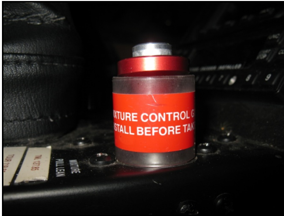
Photo 2. La commande de richesse en position plein riche avec le protecteur