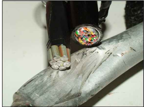
Photo 2. Marques du câble relevées sur la conduite de mise à l'air libre du carter

Des marques d'impact et un transfert de matériau du câble téléphonique ont été observés sur la conduite de mise à l'air libre du carter du moteur. Les marques d'impact sur la conduite de mise à l'air libre étaient aussi larges et espacées que les fils du câble d'acier qui soutient le câble téléphonique (voir Photo 2). Ni l'hélice ni le pneu de la roue avant ne présentaient des signes de dommages causés par un contact avec le câble. Cependant la bielle de direction droite a été fracturée en surcharge, ce qui a probablement été causé par l'impact avec le câble mais dont tout transfert de matériau a probablement été masqué par le capot moteur.