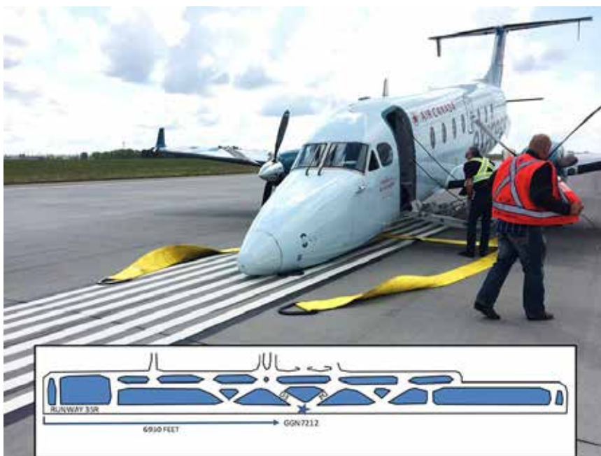
Figure 2. Position finale du C-GORF sur la piste 35R

Il y avait de la fumée et des vapeurs dans la cabine provoquées par le traînement du nez sur la piste, mais aucun incendie ne s'est déclaré. Grâce aux mesures prises par l'équipage de conduite, l'aéronef a subi un minimum de dommages, et personne n'a été blessé.