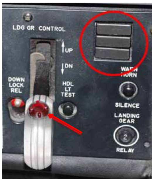
Figure 1. Voyants train sorti du Beechcraft 1900D (encadrés en rouge) et levier de commande de train (flèche)

À 6 h 50, le GGN7212 s'est établi en circuit d'attente à l'est de l'aéroport, à 8000 pieds ASL. L'équipage de conduite était en communication avec le service de maintenance d'Air Georgian, et le dépannage s'est poursuivi. On a de nouveau commandé la rentrée et la sortie du train, par le circuit hydraulique et à la main, mais la signalisation n'a pas changé. Un aéronef du Service de police de Calgary se trouvait dans les environs, et son équipage de