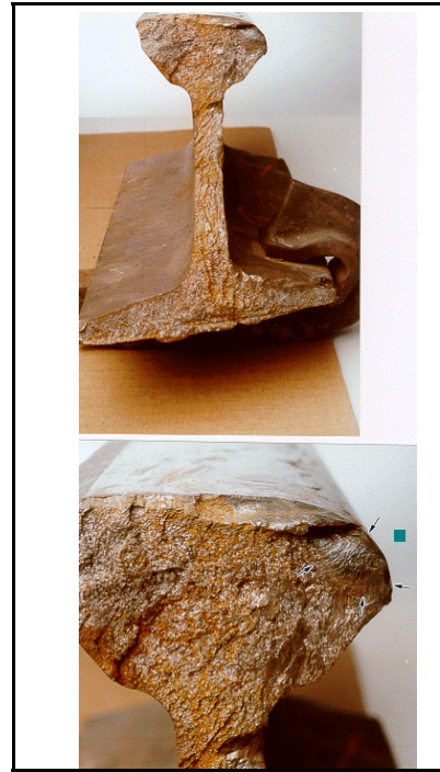
Figure 3 - Défaut transversal affectant 3 % de la surface de rupture du rail.