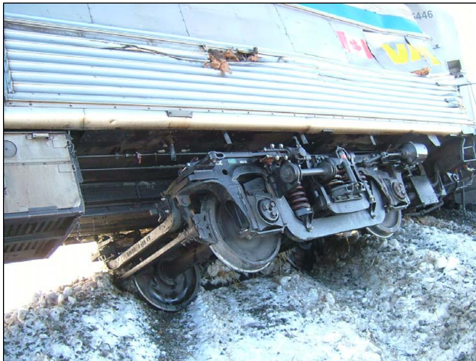
Photo 1. Vue des dommages du côté nord du fourgon à bagages 8610

Les deux locomotives ont dû être retirées du service, ayant subi des dommages considérables. Les trois premières voitures qui suivaient les locomotives se sont arrêtées dans différents angles et ont subi des dommages considérables. Les six autres voitures sont restées sur leurs roues mais elles ont déraillé à côté de la voie; elles ont toutes été endommagées à des degrés divers (voir les photos 1, 2 et 3).