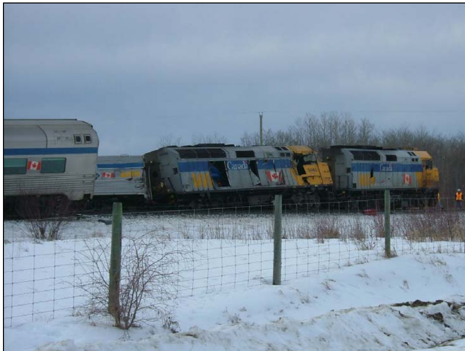
Photo 3. Vue des dommages causés au côté nord des deux locomotives

La voie ferrée a dû être refaite sur une distance de quelque 245 m à l'ouest du passage à niveau.