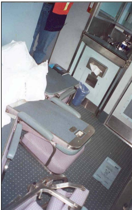
Photo 4. Couchette avec fauteuils pliants

De plus, les couchettes n'étaient pas toutes munies de fenêtres d'issue de secours. Les compartiments A à F sont des couchettes dont la porte se ferme et qui n'ont pas de fenêtres d'issue de secours (voir la figure 2).