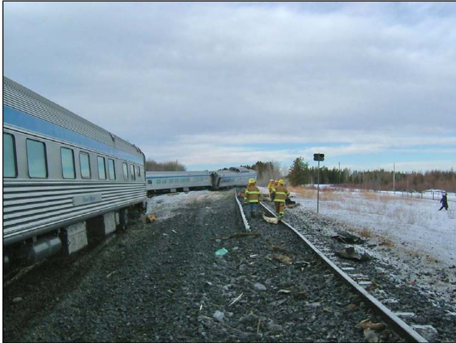
Photo 2. Vue en direction est, à partir du passage à niveau, du déraillement et des dommages causés à la voie ferrée