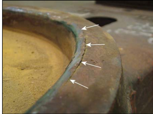
Photo 6. Rebord de la crapaudine montrant une lèvre en relief qui a été marquée par l'usure de contact