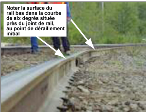
Photo 1. Surface du rail bas de la courbe de six degrés, vue du Sud

Dans le secteur du déraillement, la voie était inspectée régulièrement, conformément aux dispositions du RSV. L'inspection la plus récente de la voie, faite par une voiture rail-route, remontait au 27 août 2006 et n'avait signalé aucune anomalie. Une voiture d'évaluation de la voie a réalisé un contrôle de la géométrie de la voie le 8 juin 2006; cette inspection a révélé la présence de deux défauts nécessitant une intervention urgente (un surécartement sur une distance de 3 pieds et un défaut du nivellement transversal sur une distance de 18 pieds) et cinq défauts nécessitant une intervention prioritaire (défauts touchant l'écartement, le nivellement transversal et le dévers, et gauchissement) entre le point milliaire 153,1 et le point milliaire 153,3, dont un tronçon de 14 pieds dont le dévers était excessif ( 5\frac{7}{8} pouces), au point milliaire 153,2.