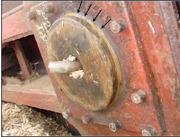
Photo 5. Pivot de caisse (bout B). Les flèches pointent vers le secteur affecté par l'usure

Les crapaudines des deuxième et troisième wagons de copeaux qui ont déraillé ont été examinées. On a remarqué que les crapaudines et les pivots de caisse montraient de l'usure au-delà des surfaces verticales situées sur les rayons extérieurs des crapaudines et pivots de caisse (voir les photos 5 et 6). Il aurait été difficile de détecter l'état des crapaudines et pivots de caisse pendant des inspections de sécurité des wagons placés dans un train, étant donné que ces pièces sont cachées sous le châssis des wagons.