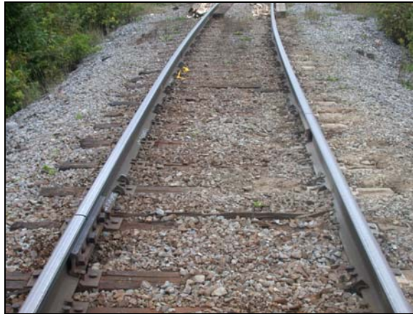
Photo 3. Positions des joints de rail vus du Sud

Noter la surface du rail bas dans la courbe de six degrés située près du joint de rail, au point de déraillement initial