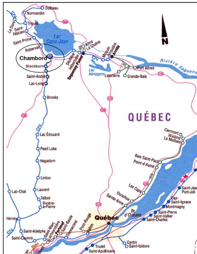
Figure 1. Secteur du déraillement, Chambord (Québec)

Lors de l'accident, la température était d'environ 16°C et le ciel était nuageux. Des faibles averses de pluie (précipitations de 7 à 9 mm) avaient été enregistrées dans le secteur au cours de la journée.