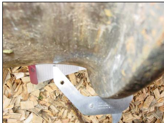
Photo 4. Boudin de roue trop haut sur un essieu monté

On a remarqué que, pour un essieu monté déraillé, la hauteur des boudins de roues était supérieure à 1 ½ pouce, ce qui excédait les limites énoncées dans le Règlement concernant l'inspection et la sécurité des wagons de marchandises , approuvé par TC (concernant les boudins trop hauts, voir la photo 4).