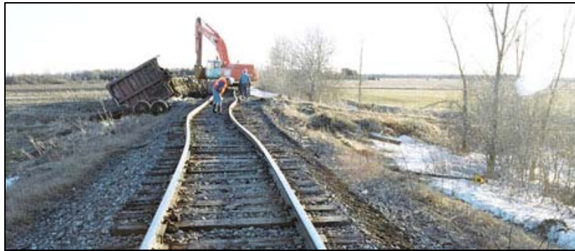
Photo 1. Gauchissement de la voie et secteur du déraillement vus du nord

À l'extrémité nord du lieu du déraillement, la voie était gauchie et s'était déplacée latéralement vers l'est sur une distance atteignant 24 pouces. La zone affectée par le gauchissement commençait à 72 pieds au nord du passage à niveau de ferme, et la voie décrivait un « S » en direction sud, jusqu'à la surface du passage à niveau (voir la photo 1).