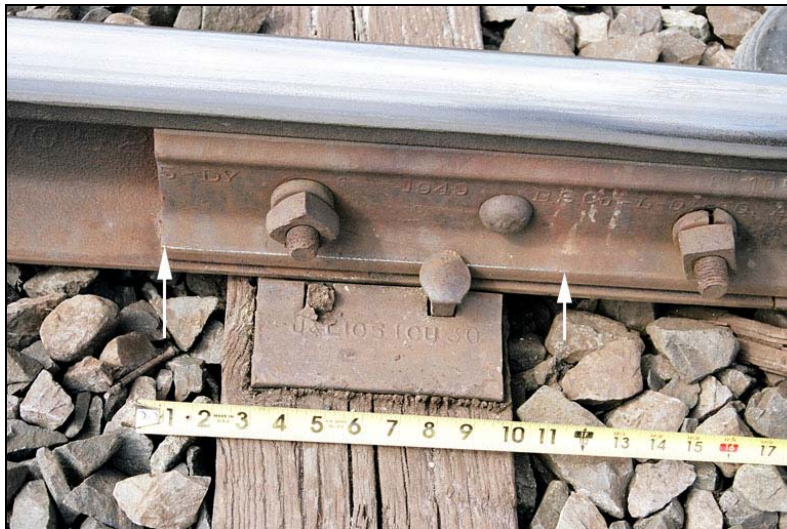
Photo 2. Marques de cheminement du rail observées le long de la base d'une éclisse