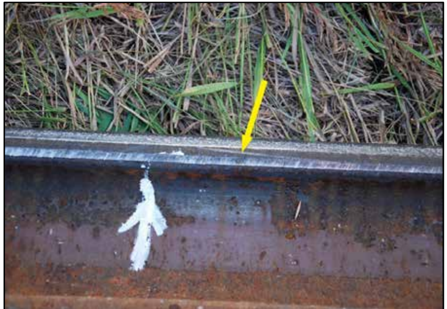
Figure 2. Marques de boudin de roue sur le champignon du rail au point de déraillement (indiquées par la flèche jaune)

Selon les marques de boudin de roue sur le champignon du rail (figure 2), le rail haut s'est probablement